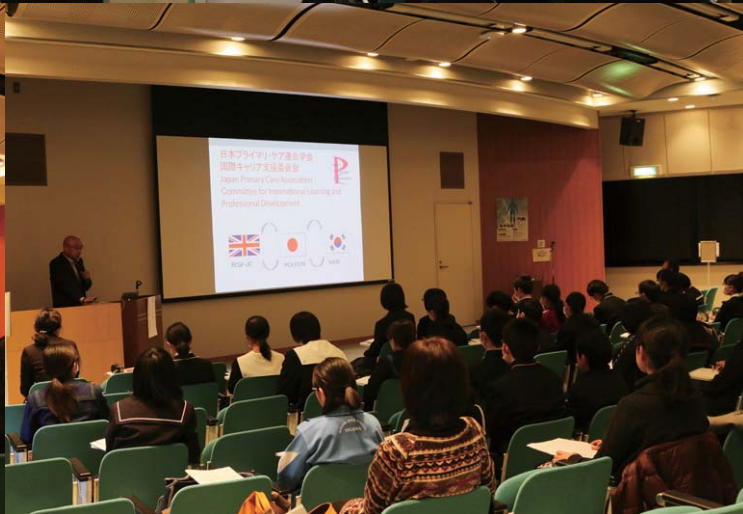
○ 福島県立医科大学での講義・集合写真